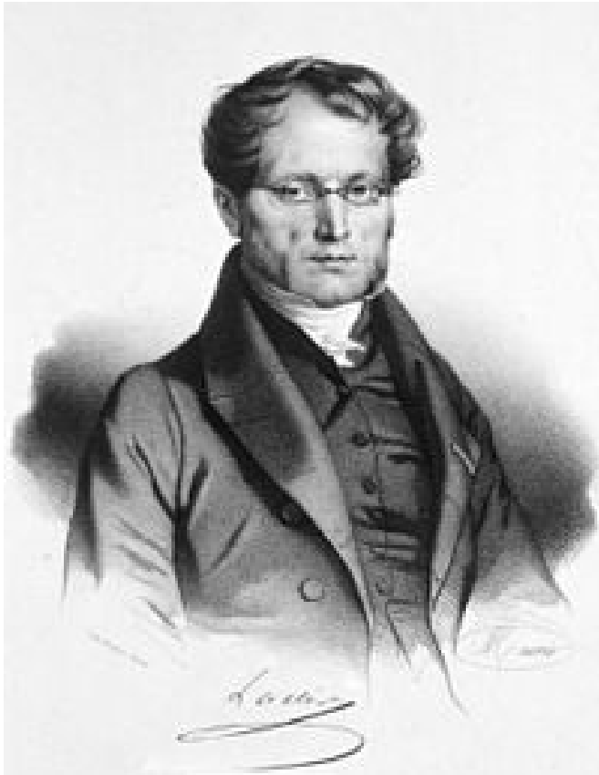
Pierre Charles Alexandre Louis 1787-1872