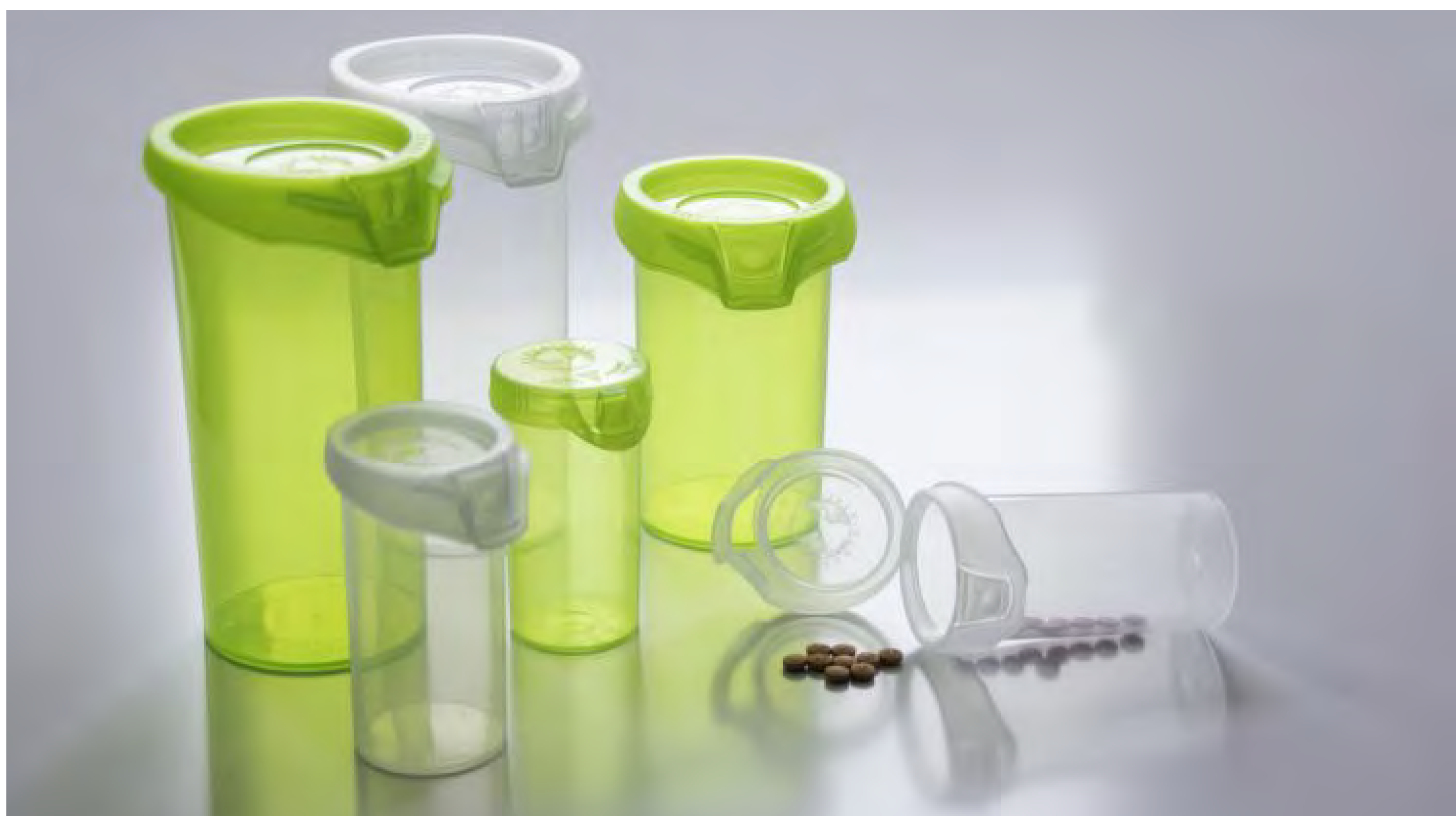
Fioles en polypropylène 100 % recyclables

Pour l'IRS, faire preuve d'écoresponsabilité implique d'avoir recours à un produit, un processus ou une méthode qui réduit les impacts environnementaux négatifs d'une innovation. Le cycle de vie d'une innovation en santé comprend cinq étapes clés [54] et l'écoresponsabilité peut être prise en compte à plusieurs, sinon à chacune de ces étapes. L'explication des étapes clés, ci-dessous, n'est pas exhaustive, mais nous y intégrons des exemples concrets pour les illustrer.