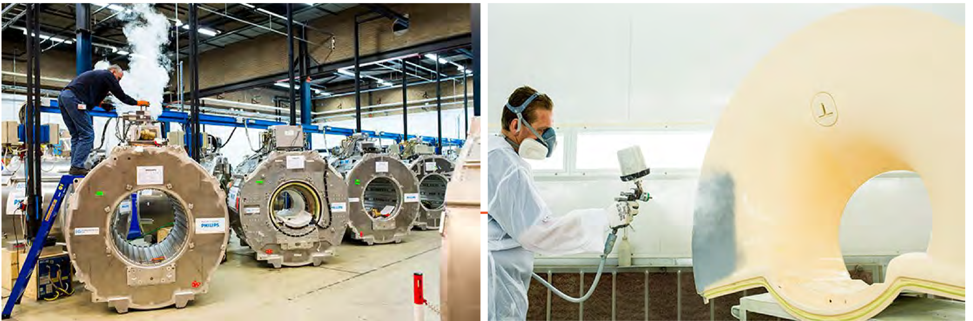
Centre de remise à neuf des systèmes d'imagerie médicale de Philips aux Pays-Bas

En s'appuyant sur les principes de l'économie circulaire, des fabricants d'équipements médicaux comme Philips démontrent qu'il est possible de prolonger la durée de vie de leurs équipements. En 2016, Philips a ouvert un centre de remise à neuf des systèmes d'imagerie médicale à Best, dans le sud des Pays-Bas. Les gros aimants très puissants qui font partie intégrante de tous les appareils de résonance magnétique (et qui servent à produire un puissant champ magnétique) sont démontés, récupérés puis réutilisés pour la fabrication d'appareils remis à neuf.