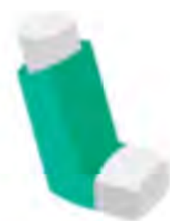
Seretide Evohaler (MDI)