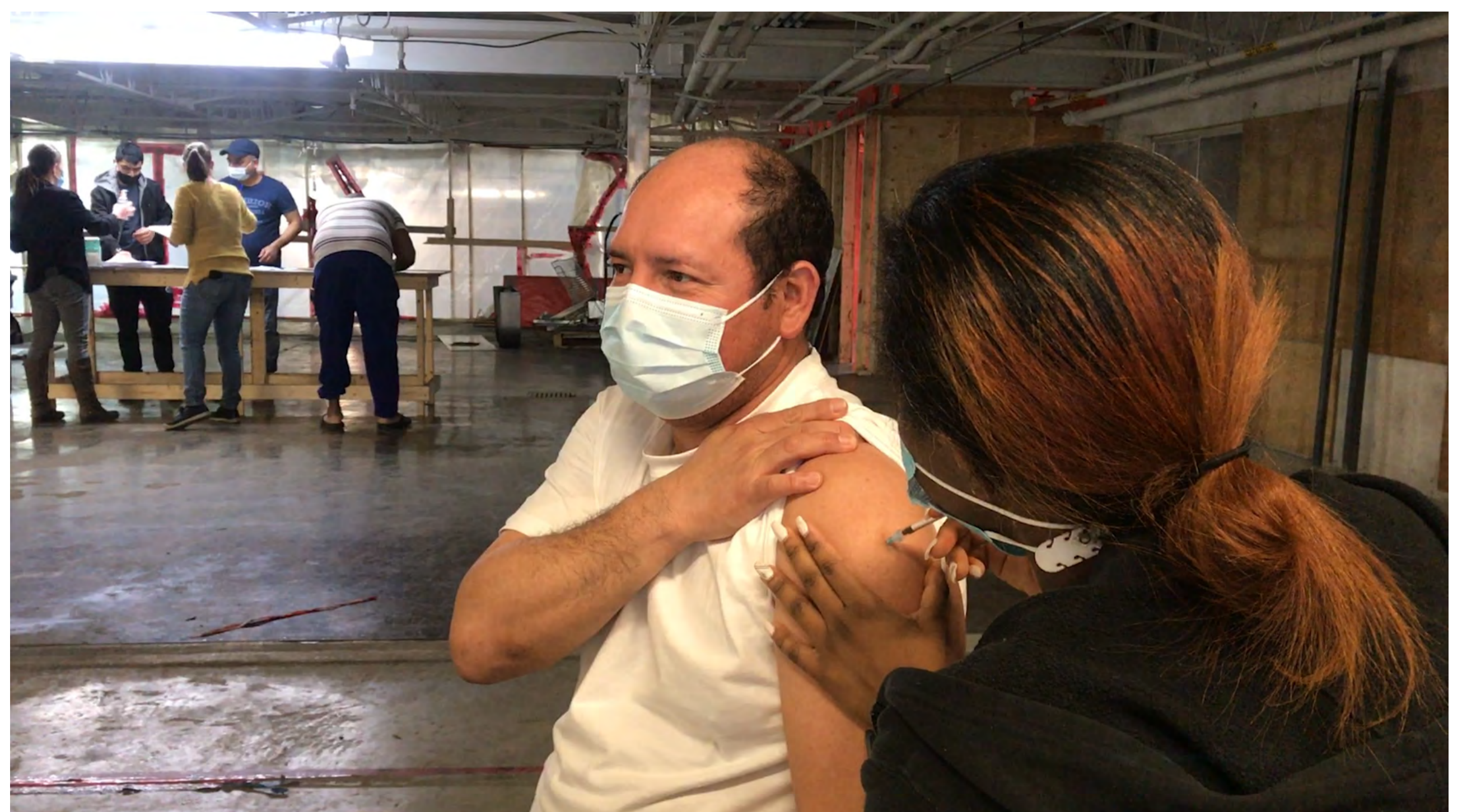
Clinique de vaccination mobile mise sur pied par le CIUSSS du Nord-de-l'Île-de-Montréal

L'équipe qui développe une innovation responsable s'assure que les moyens de mitiger ses impacts négatifs sont disponibles pour presque tous les AEJS applicables.