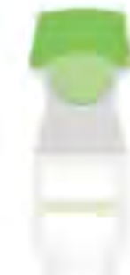
Respimat « Soft Mist »